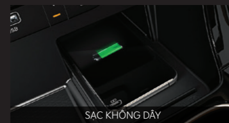
SẠC KHÔNG DÂY

Để kiểm soát các thông tin xung quanh, khoang lái Carnival được thiết kế bố trí khoa học, hiển thị những thông tin quan trọng và cần thiết giúp người lái luôn giữ tập trung khi đang lái xe.