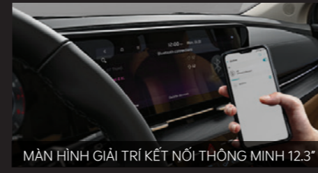
MÀN HÌNH GIẢI TRÍ KẾT NỐI THÔNG MINH 12.3"