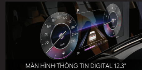
MÀN HÌNH THÔNG TIN DIGITAL 12.3"